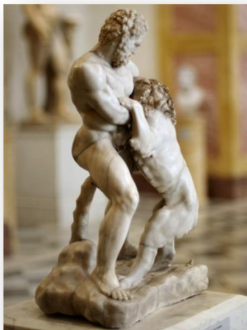
Геракл, раздирающий льва