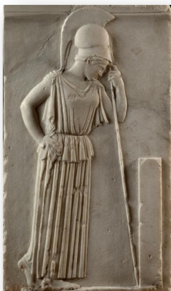
Рельеф «Задумавшаяся Афина»

Реликвии, воспетой Гомером древней цивилизации, непревзойденное изящество греческой скульптуры, оружие времен походов Александра Македонского, серебряные и золотые монеты с изображением правителей и богов – все это и многое другое доступно широкой публике.