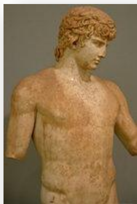
Аполлон, покровитель искусств