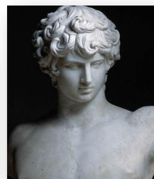
Дионис, бог виноделия