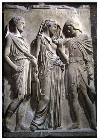
Рельеф «Гермес, Эвридика и Орфей»