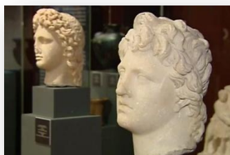
Бюст Александра Македонского, монеты с его изображением